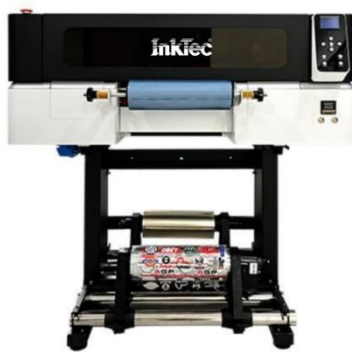
INKTEC UV DTF-300

UV-DTF (ULTRAVIOLET DIRECT TO FILM) – это революционная технология, позволяющая переносить изображения на самые разные материалы, включая: пластик, металл, керамику и другое. С помощью наших материалов вы сможете создавать яркие, устойчивые к внешним воздействиям отпечатки.