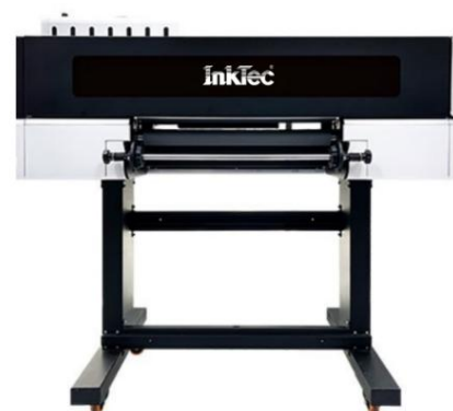
INKTEC UV DTF-600